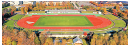
旭川市花咲スポーツ公園陸上競技場施設整備工事を施工(2022年)