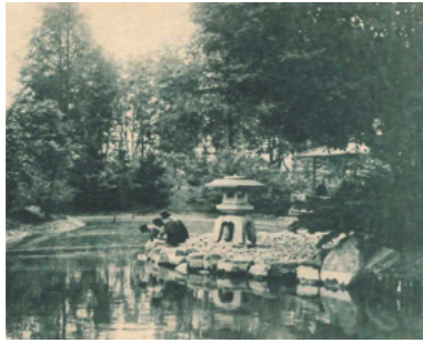
遊庭として市民に開放した翠香園