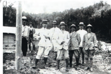
初一が設立した大雪山調査会