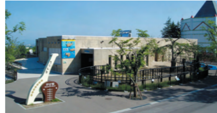
旭山動物園カバ館を新築施工(2013年)