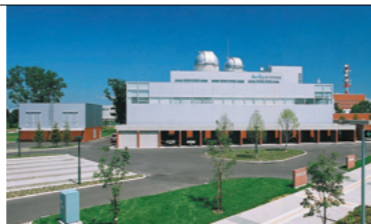
旭川市青少年科学館（現・サイバル）を新築施工(2005年)